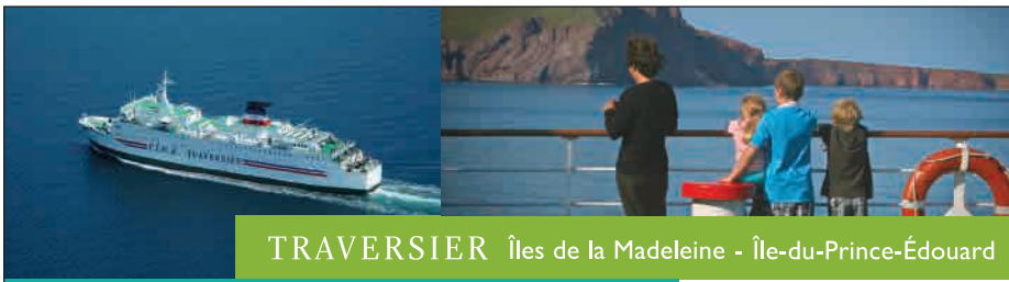
TRAVERSIER Îles de la Madeleine - Île-du-Prince-Édouard

380, Ch. Principal, Suite 201, Cap-aux-Meules (Québec) G4T 1C9 418-986-2545 prod@gemini3d.com