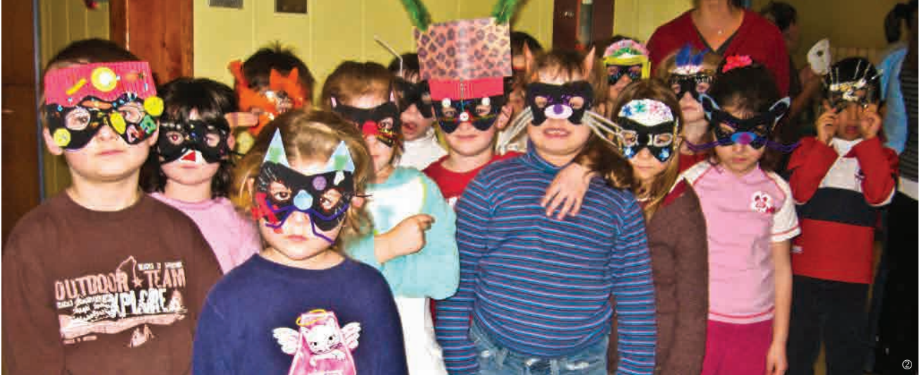
▲ Des élèves de l'École primaire Stella-Maris de Fatima masqués pour la Mi-Carême.