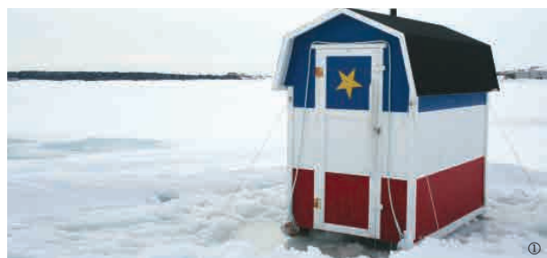
▲ Cabane arborant les couleurs acadiennes

La pêche blanche s'inscrit ainsi, au fil des ans, comme une véritable tradition aux îles. Les pêcheurs s'adaptent aux particularités du paysage madelinot et deviennent, au fil des saisons, des fins observateurs de toute cette vie qui se poursuit sous les glaces. L'occasion est belle pour aller à leur rencontre, écouter leurs histoires et espérer, que la pêche soit bonne.