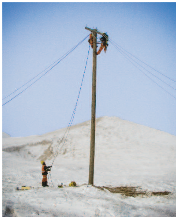
▲ En camion à nacelle ou à l'éperon, les monteurs ont travaillé d'arrache-pied pour reconstruire le réseau.

L'objectif de la journée est de terminer le rétablissement.