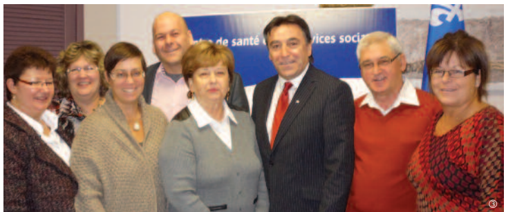
▲ Avec la direction du CSSS, ainsi que des membres représentant le conseil d'administration et le comité des usagés.