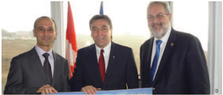
▲ Accompagné de Guglielmo Tita, directeur général du Centre de recherche sur les milieux insulaires et maritimes (CERMIM) et de Pierre Arcand, ministre du Développement durable, de l'Environnement et des Parcs lors de l'annonce de l'étude de faisabilité d'une aire marine.

397-B, chemin Cap-aux-Meules Tél.: (418) 986-4140 Téléc.: (418) 986-2577 gchevarie-idlm@assnat.qc.ca