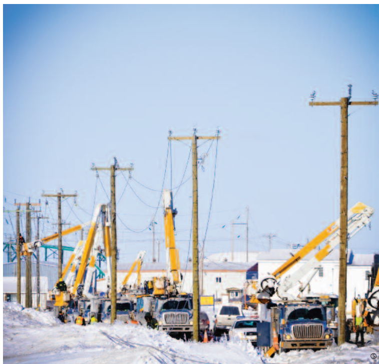
▲ Trente-huit camions à nacelle ont été amenés des autres régions pour l'opération de rétablissement.

Un troisième bateau arrive en soirée avec, entre autres, une génératrice de 2 MW qui permettra de rétablir le service chez une partie des clients de Grosse-Île et de Grande-Entrée.