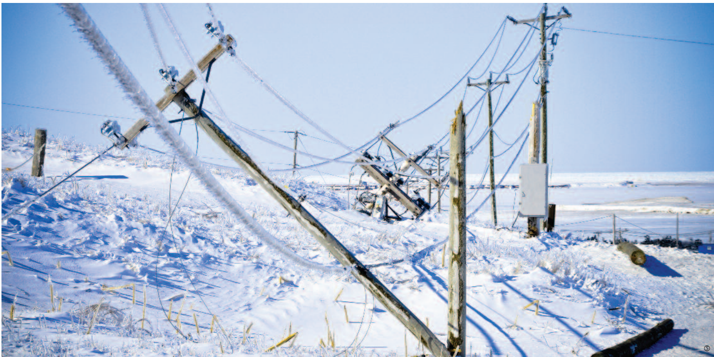
▲ Plus de 230 poteaux du réseau de distribution, ainsi que 17 poteaux du réseau de transport ont été endommagés par le verglas et le vent.